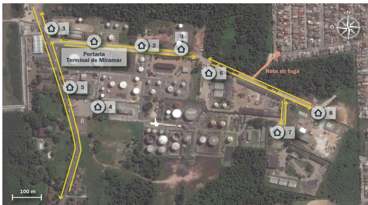
Figura 6: Portarias de acesso ao Terminal Petroquímico de Miramar

O Terminal Petroquímico de Miramar possui dois pátios internos para estacionamento de caminhões, o que contribui para a organização do fluxo de veículos dentro do terminal, no entanto, estes não possuem pavimentação adequada nem sinalização vertical ou horizontal.