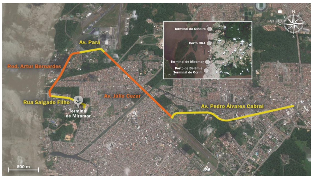
Figura 5: Vias de entorno ao Terminal Petroquímico de Miramar

O entorno do Terminal Petroquímico de Miramar é caracterizado pela existência de áreas urbanas, e seu acesso é feito, principalmente, pelas vias mostradas na figura a seguir.