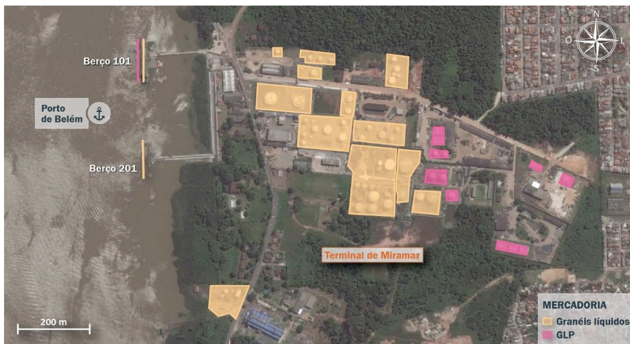
Figura 3: Destinações operacionais dos berços em relação às áreas de armazenagem

As operações portuárias realizadas nos berços são executadas pelos próprios arrendatários e por operadores portuários. Os berços são compartilhados entre os terminais voltados à operação de combustíveis. A figura a seguir mostra a correlação entre os produtos movimentados nos berços e as áreas/installações.