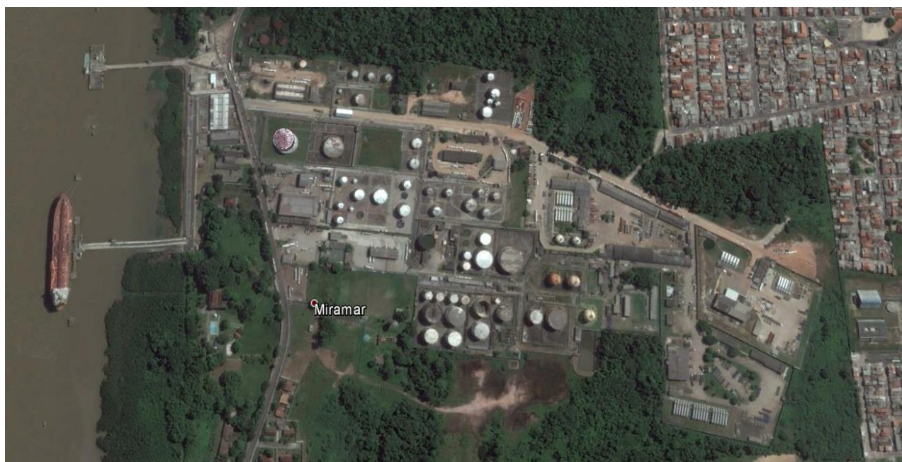
Figura 1: Localização do Terminal Petroquímico de Miramar

O Terminal Petroquímico de Miramar está localizado na margem direita da baía de Guajará, formada pelo encontro da foz dos rios Acará e Guamá, a uma distância de 5 km do Porto de Belém, circunscrito a áreas urbanas do município. A figura a seguir apresenta imagem aérea do Terminal Petroquímico de Miramar.