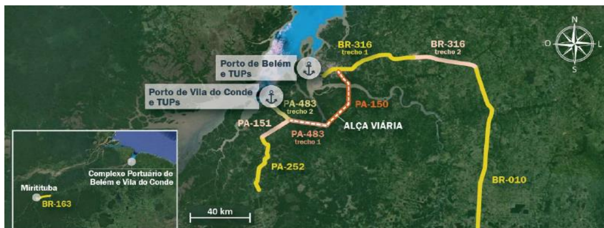
Figura 4: Vias de acesso ao Terminal Petroquímico de Miramar

O entorno do Terminal Petroquímico de Miramar é caracterizado pela existência de áreas urbanas, e seu acesso é feito, principalmente, pelas vias mostradas na figura a seguir.