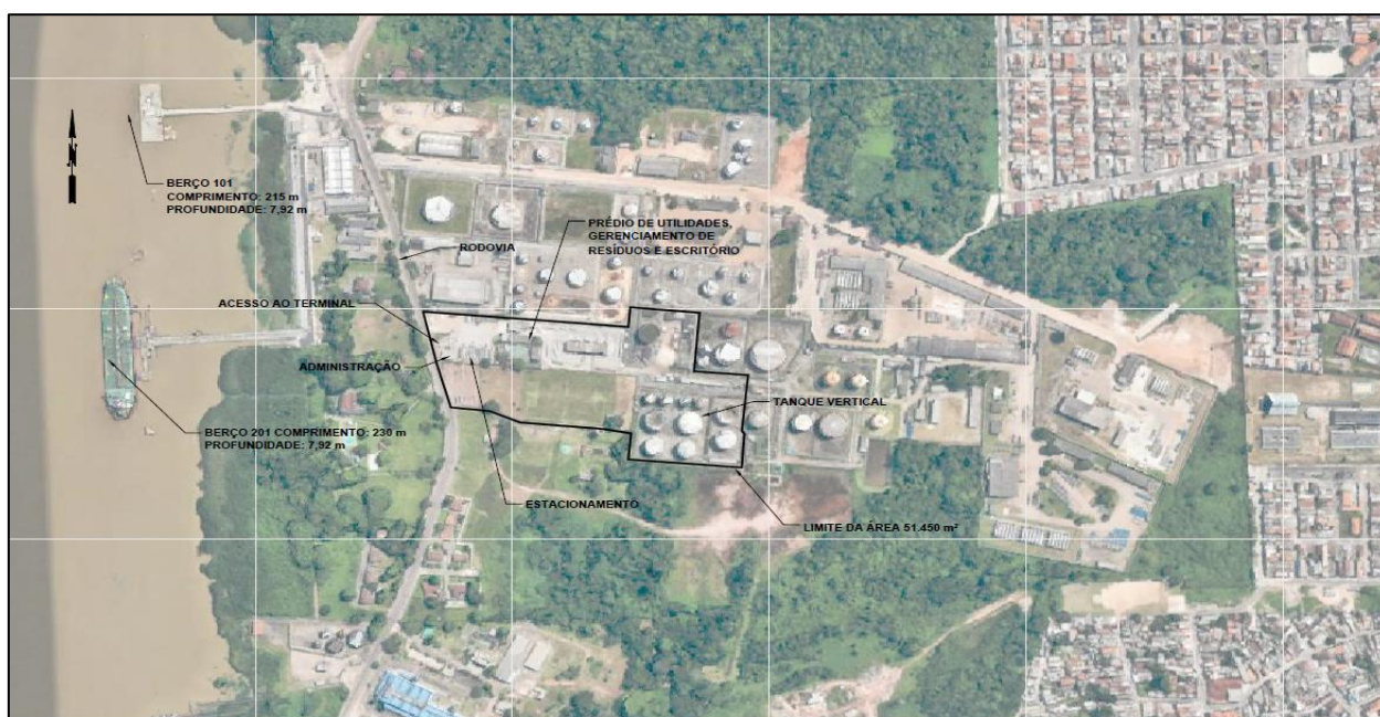
Figura 8: Localização da área do arrendamento BEL08

A superfície da área de arrendamento é de aproximadamente 51.450m 2 , com conexões de rodovia e cais, conforme indicado na figura a seguir.